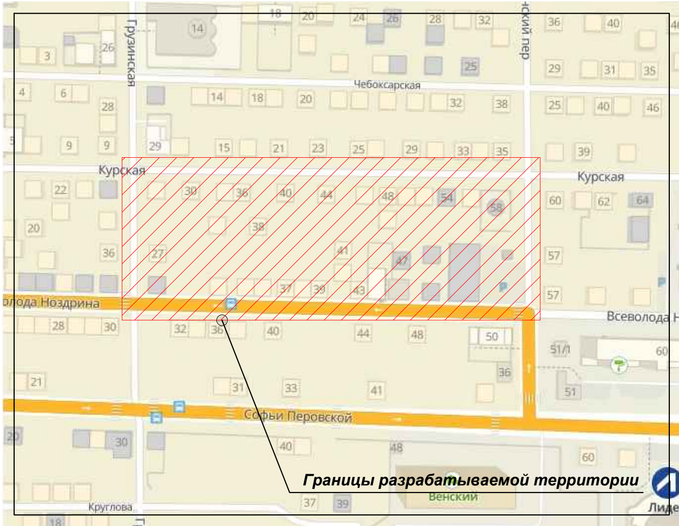
Схема планировочной организации земельного участка разработана в соответствии с действующими нормами и правилами и обеспечивает взрыво- и пожаробезопасную эксплуатацию при соблюдении предусмотренных проектом мероприятий